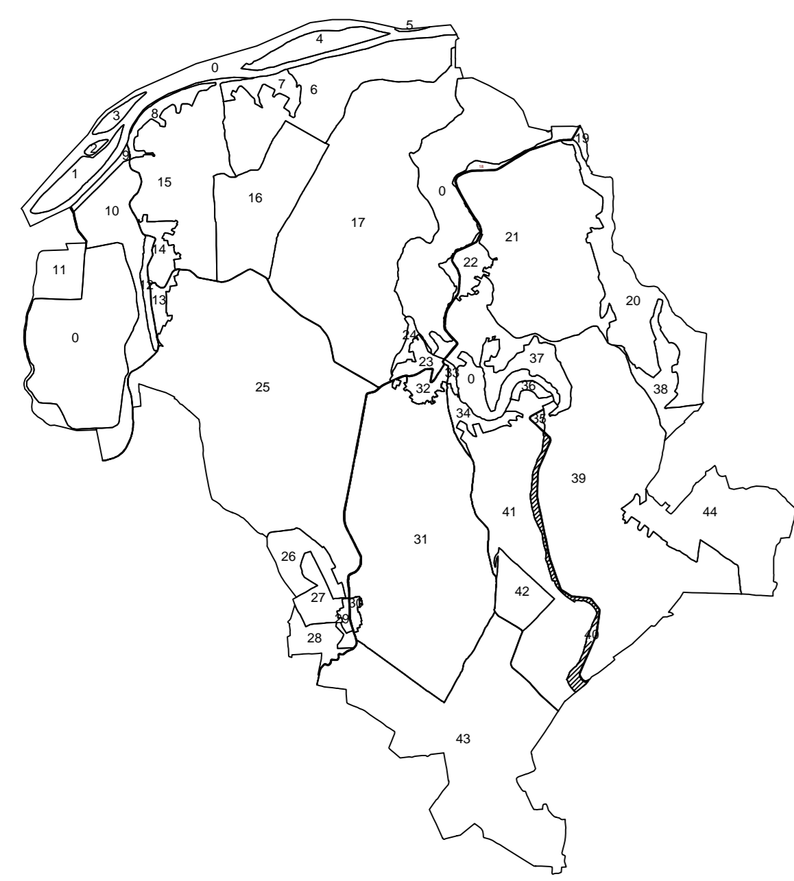
Schita cu dispunerea sectoarelor cadastrale